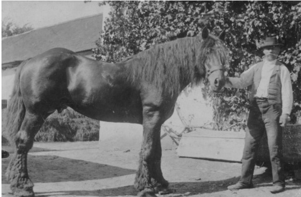
Mein Ururopa mit einem seiner Hengste, Originalfoto von 1910 (oben) und danach angefertigte Zeichnung (rechts)

Um einerseits wieder Kontakt zu Pferden und andererseits auch einen Vorrat an außergewöhnlichen Motiven zu haben, nahm ich 2006 an einer Fotoreise von Gabriele Boiselle teil. Wunderschöne Pferde, gleichgesinnte Mitreisende und eine enthusiastische Fotografin und Reiseleiterin sind gute Gründe immer wieder an Reisen und Seminaren teilzunehmen. Einige Zeichnungen sind nach den Fotos bereits entstanden, viele warten noch auf die Ausführung, und ich bin sehr glücklich, wieder meine beiden Vorlieben, die Pferde und das Zeichnen, verbinden zu können.