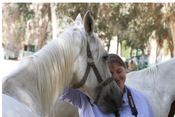
El Zahraa, Fotoreise mit Gabriele Boiselle, Kairo 2008